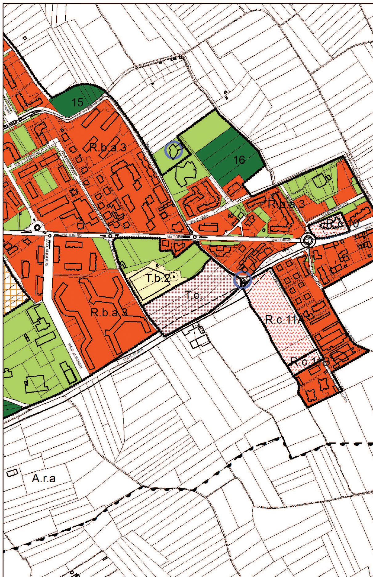
TAVOLA P2a (estratto) - scala 1: 5.000 STATO ATTUALE